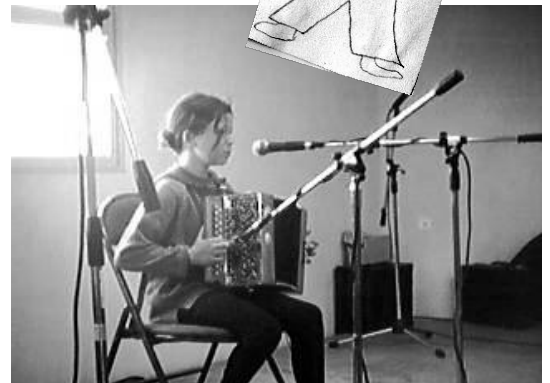
Plus de photo de scène avec une armée de micros sous le nez !