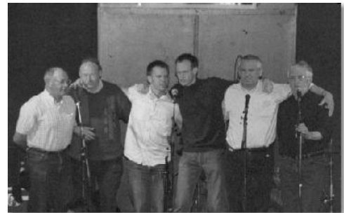
Le groupe Trouzerion en 2003 à Klegereg

..... arrive à une fille peu recommandable