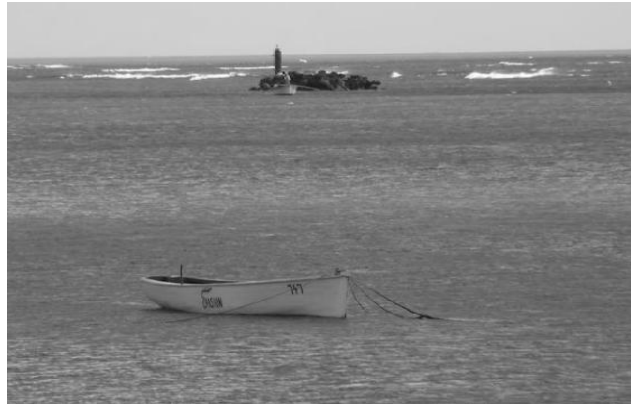
En raison de son isolement et de sa pauvreté, l'île Rodrigues a longtemps été dénommée «la Cendrillon des Mascareignes».

Il y a encore dix ans, l'accompagnement traditionnel de l'accordéon était fourni par l'arc musical, le triangle et différents petits audiophones, boîtes de conserves ou coquillages frottés, battoirs. Depuis, une tendance très récente tend à faire accompagner les morceaux de séga-kordéon par le tambour jusqu'ici réservé au seul séga-tambour.